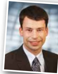
Steffen Bilger Einer der jüngsten Mitglieder des Deutschen Bundestags

Er ist eines der jüngsten Mitglieder des Deutschen Bundestages, dem er seit Oktober 2009 angehört (Wahlkreis Ludwigsburg). Im vergangenen Jahr wurde er als Api-Hoffnungsträger ausgezeichnet. Jetzt ist er unser Aktionstag-Gast: Steffen Bilger – er sitzt mitten im Bundestag und nimmt zugleich seinen politischen Einsatz bewusst als Christ wahr.